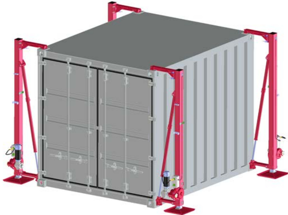
Abb. zeigt Ausführung mit automatischer Nivellierung 230 V AC / fig. shows option ‚Autolevelling 230 V AC‘ / fig. avec option « Mis à niveau automatique 230 V AC »

Dispositif de levage 20 t démontable, type 1889.20